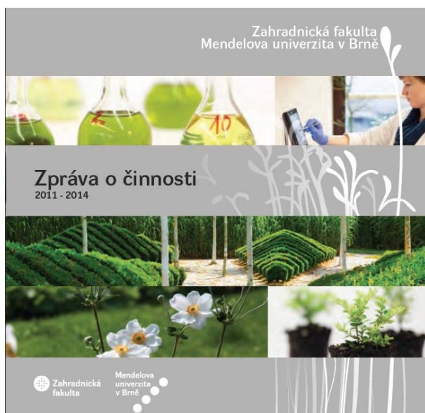
Zpráva o činnosti fakulty 2011-2014

Splněno ve všech bodech, díky projektům OP VK byla navíc vytvořena komplexní prezentační sada ZF MENDELU (prezentační bannery, rollupy, pop-up stěna a prezentační stolky) potřebná pro moderní prezentaci na výstavách a veletrzích odpovídající soudobým způsobům firemní propagace. Současně bylo zpracováno portfolio tištěných propagačních materiálů v českém i anglickém jazyce – 4 brožury, 10 letáků o ústavech a 4 obecné letáky o ZF MENDELU, včetně letáku k Akademické zahradě. Pro rok 2015 byl připraven přehled akcí i náměty na specifické materiály k 30. výročí ZF MENDELU. V plánu je rovněž další tištěná brožura o historii ZF MENDELU ve stejném designu jako již hotové publikace. Experimentální zahrada momentálně prochází výraznými změnami, práce na propagačním letáku k této části kampusu byly pozastaveny.