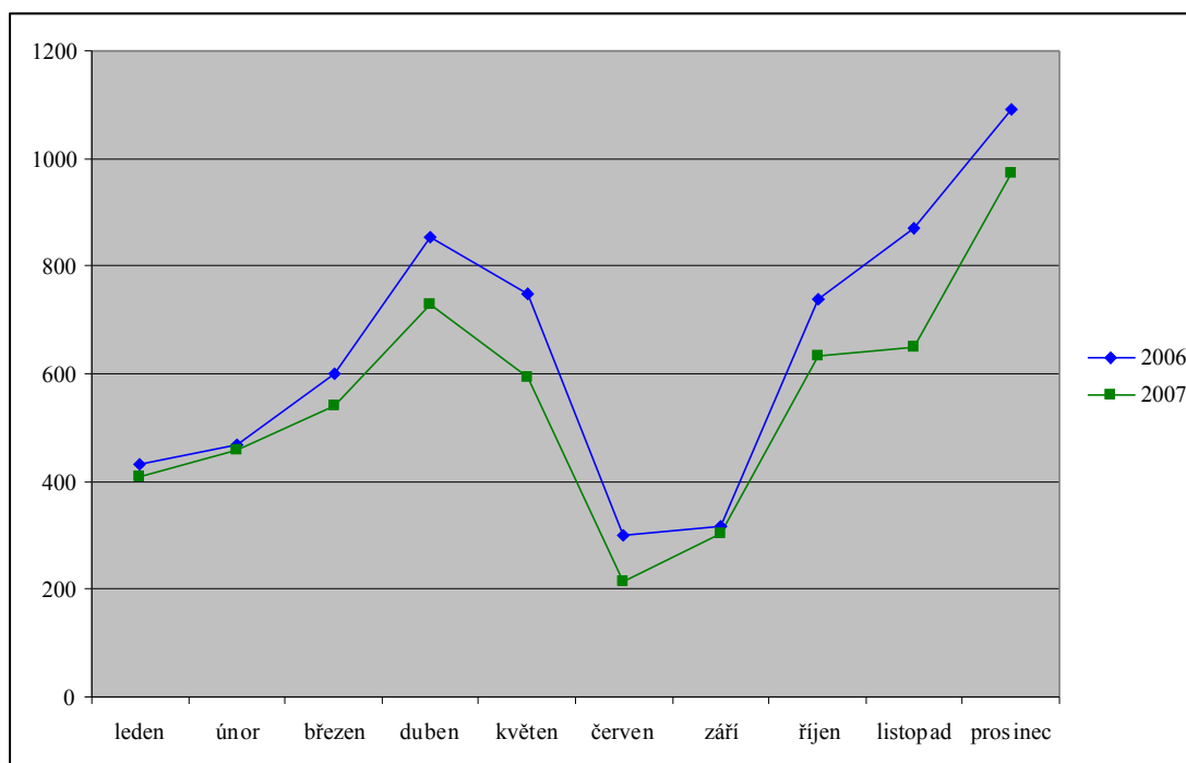
Graf č. 2: Průměrná denní návštěvnost studovny v letech 2006 a 2007

Na část letních prázdnin se studovna vždy zavírá z důvodu katalogizování vysokoškolských závěrečných prací.