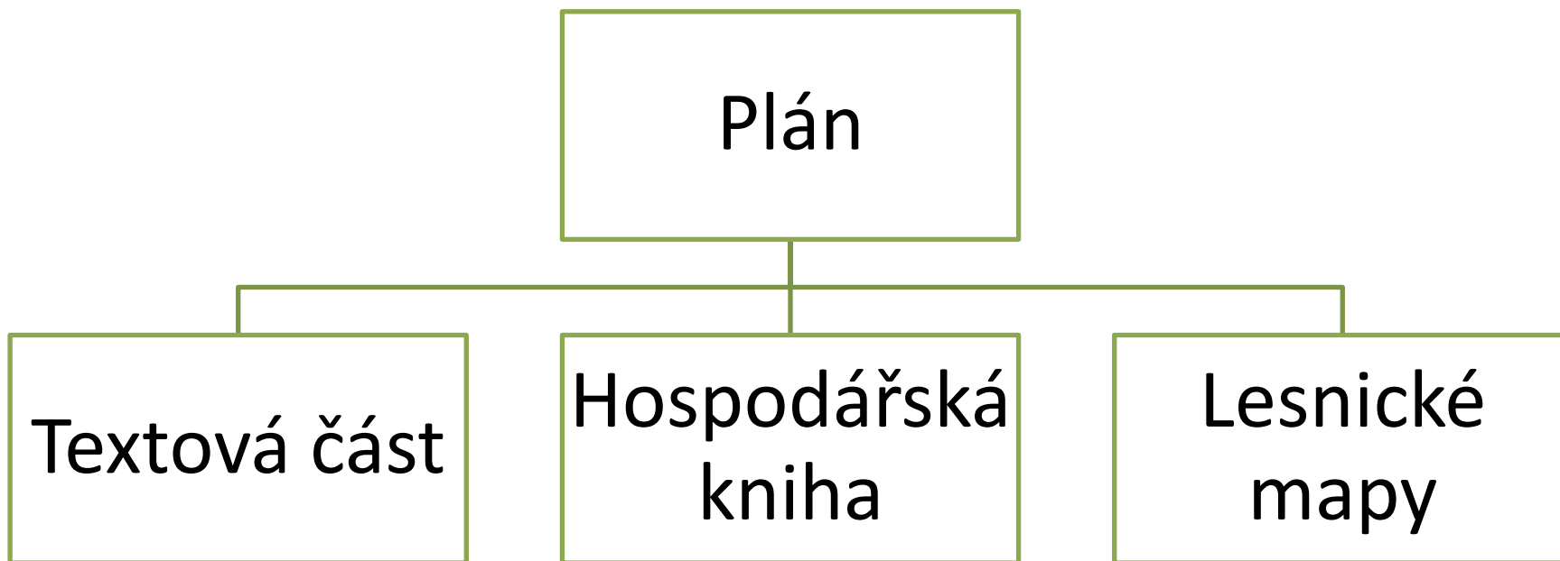
Schéma náležitostí plánu